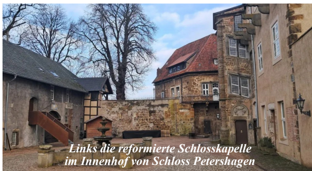
Links die reformierte Schlosskapelle im Innenhof von Schloss Petershagen

Anschließend gibt es die Möglichkeit zum Mittagssimbiss