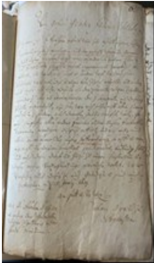
Brief des Johann von Wittgenstein an den Großen Kurfürsten aus dem Jahr 1651 (Archiv Petrigemeinde Minden)

Auch das damalige Pfarrhaus gibt es noch, es ist das Fachwerkhaus der heutigen Buchhandlung Betz. Erst 1674 bezog unsere Gemeinde dann den heutigen Standort mit einer kleinen Kirche an der Ritterstraße in Minden, nachdem die Verwaltung des Kurfürsten nach Minden umgezogen war. Erst im Jahr 1743 wurde dann als Neubau die heutige Petrikirche fertiggestellt, nachdem die alte Kirche baufällig und für die, auch durch die Hugenotten größer gewordene Gemeinde zu klein geworden war. Bis etwa 1805 wurde die Schlosskapelle in Petershagen als Zweitkirche weiter verwendet bis die napoleonischen Truppen das Schloss beschlagnahmten und die Kapelle zum Pferdestall wurde.